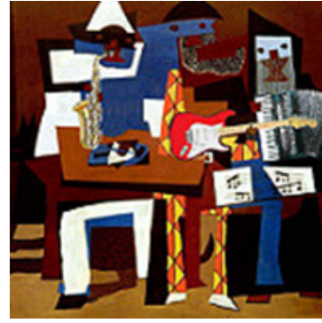
Picasso. Tres músicos. 1921

1. ¿Qué aspectos encuentras en común entre las tres obras?