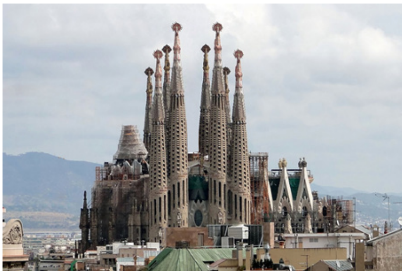
Templo expiatorio de la Sagrada Familia. Antoni Gaudí. 1882. Barcelona España

Observa las imágenes, busca información sobre ellas y responde las preguntas.