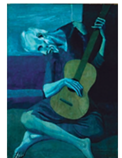
The old guitarist 1904