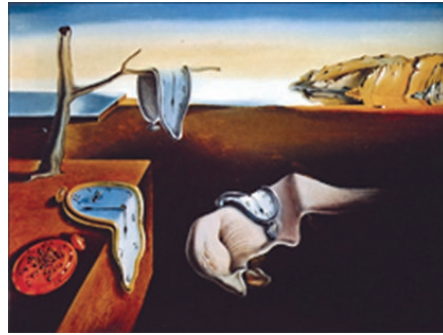
La persistencia de la memoria 1931