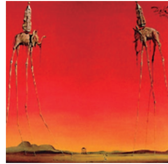
The elephants 1948