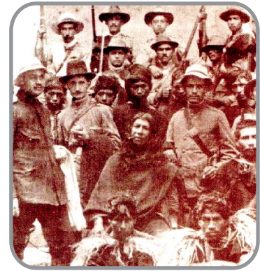
(Quintín Lame detenido por la policía colombiana, junto a sus compañeros indígenas de lucha, por liderar un levantamiento rebelde agrícola en El Cofre, Cauca, en 1915.)

Empieza el movimiento de Manuel Quintín Lame, un movimiento de liberación indígena que buscaba la autonomía territorial, económica, política y cultural de las sociedades indias.