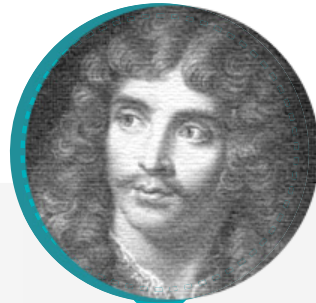
Jean Baptiste Poquelin, Moliere

Fue escritor, filósofo, músico, botánico y naturalista. Las ideas políticas de Rousseau influyeron en gran medida en la Revolución francesa, el desarrollo de las teorías republicanas y el crecimiento del nacionalismo. sus dos frases célebres, son en El contrato social: «El hombre nace libre, pero en todos lados está encadenado»; la otra, en Emilio, o De la educación: «El hombre es bueno por naturaleza».